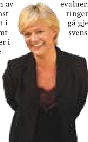
Kristin Halvorsen Finansminister

Regjeringen har lagt opp til bred deltakelse i prosessen med strategien og til at strategien skal favne vidt. Arbeidet med bærekraftig utvikling må skje på bred front, både gjennom offentlige virkemidler og gjennom lokalt og individuelt engasjement i næringsliv, organisasjoner, kommuner og husholdninger.